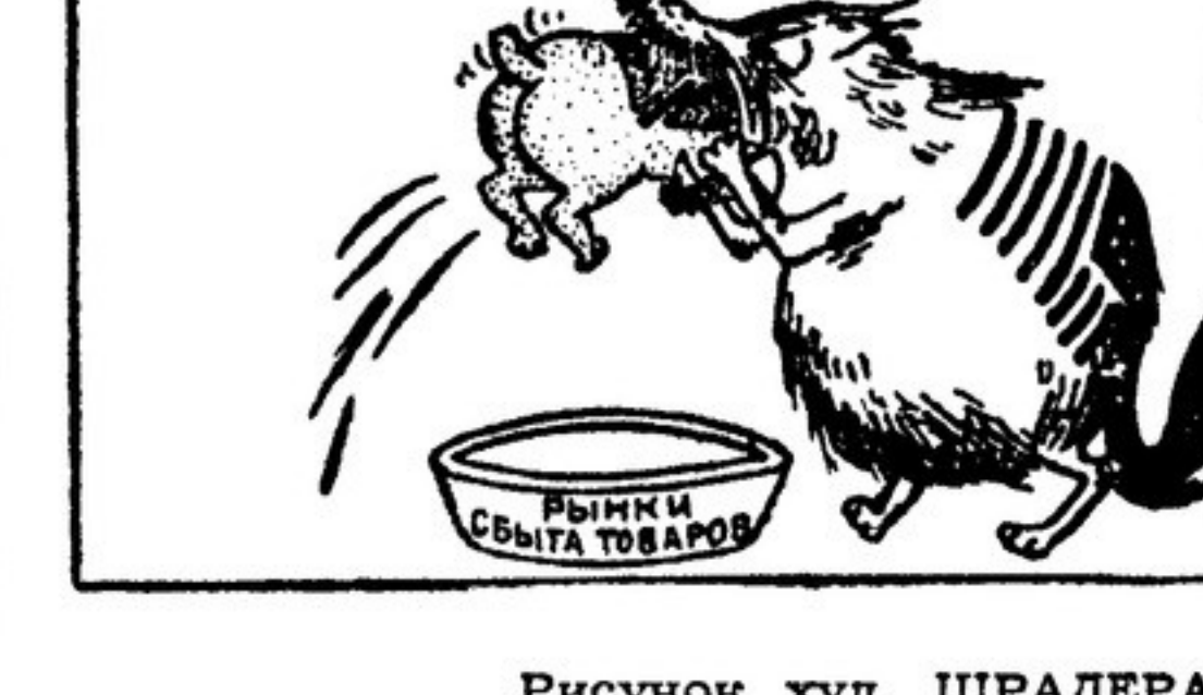
Рисунок худ. ШРАДЕРА из немецкого журнала «Фришер винд»